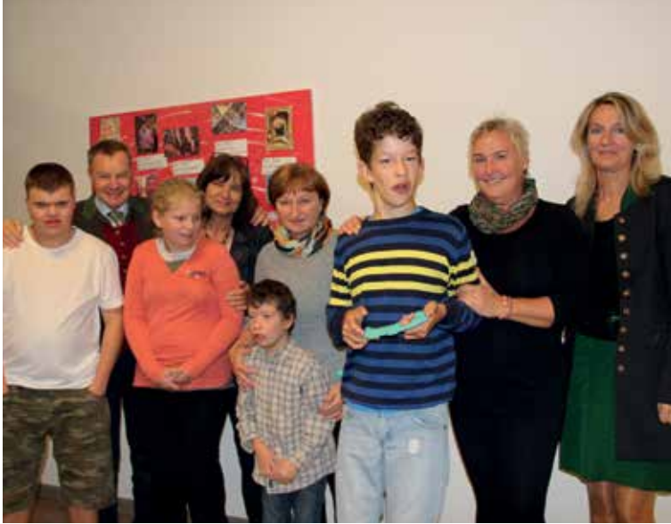
FERIENWOCHE DES ZIS GRÖBMING MIT DER LEBENSHILFE