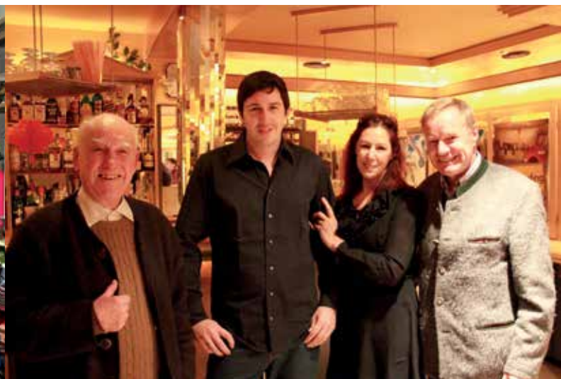
VORSTELLUNG DES VEREINS MARY'S MEALS IM KINO GRÖBMING