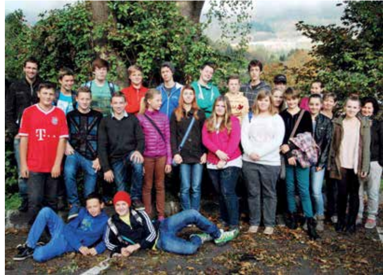
Foto: Unsere diesjährigen Konfirmanden mit Begleiter/innen beim steirischen Konfirmandentreffen in Leoben

Neben Gemeinschaft, Spiel und Spaß ist es uns wichtig, gemeinsam im Glauben und in der Beziehung mit Gott zu wachsen. Bei Fragen zu unseren Angeboten, freuen wir uns über ein E-Mail: samuel.bauer@hotmail.com