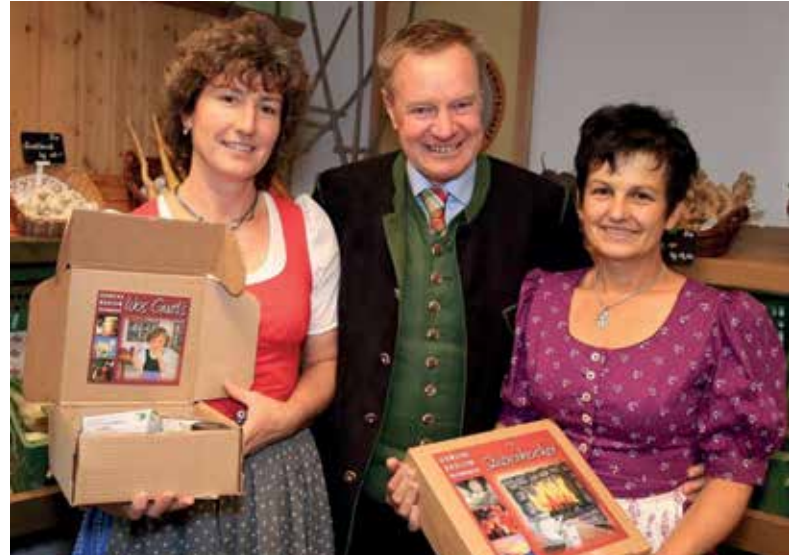
15 JAHRE BAUERNLADEN IN GRÖBMING

Weihnachtsbeleuchtung NEU mit LED ausge-