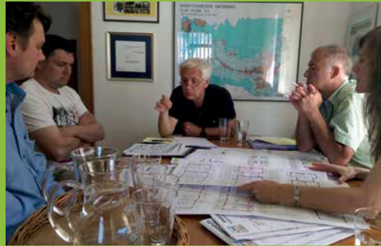
BAUVERHANDLUNG DER ENNSTALER SIEDLUNGSGENOSSENSCHAFT