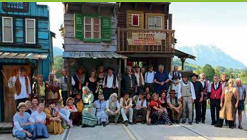
THEATER MOOSHEIM „WILLKOMMEN IN SCUM CITY“