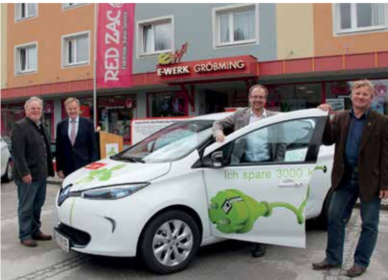
EINFÜHRUNG DES E-FLITZER'S IN GRÖBMING

der Warteschlange und die gesamten Straßenrenovierungen werden ebenfalls auf die lange Bank geschoben und verzögert. Auch das E-Werk Gröbming möchte ihre Leitungen mit den Heizwerkleitungen erneuern und damit die Versorgungssicherheit für unser Gröbming verbessern und ausbauen.