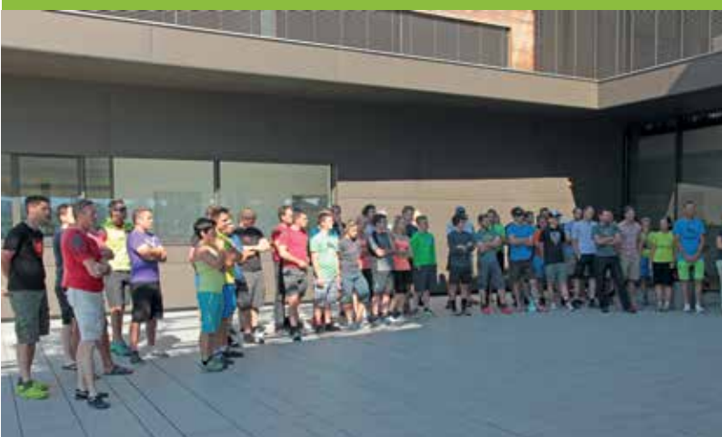
SOMMERAUSBILDUNGSKURS DER STEIRISCHEN BERGRETTUNG