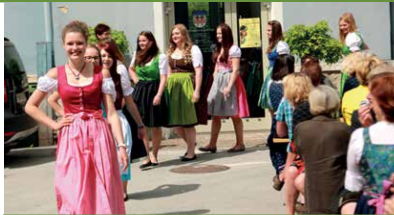
DIRNDLMODESCHAU DER FACHSCHULE FÜR LAND- UND ERNÄHRUNGSWIRTSCHAFT

Die junge Gröbminger Musikgruppe „Appa“ eröffnete mit schwungvollen Rhythmen die Sonderausstellung 2014. Die heurige Ausstellung „Unser G`wand“ erforderte einen außerordentlichen Einsatz des Museumsteams; in etwa 1.000 Stunden entstand diese anspruchsvolle Ausstellung im Dachboden des Museums. Die Mädchen der Fachschule zeigten die Vielfalt der Dirndl unserer Region, anschließend ihre selbst geschneiderten Dirndl, die sie im Fachunterricht angefertigt hatten. Diese großartige Modenschau vor dem „Gröbminger Museumslaufsteg“ wurde von den Zuschauern mit viel Applaus bedacht.