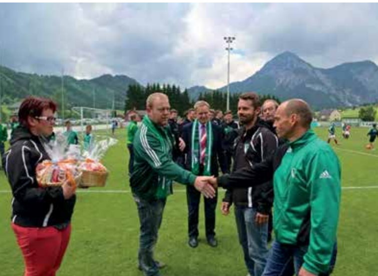
EHRUNG VERDIENTER TUS-FUNKTIONÄRE