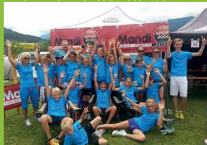
FLINKE HORDE BEIM 24 STUNDENLAUF IN IRDNING