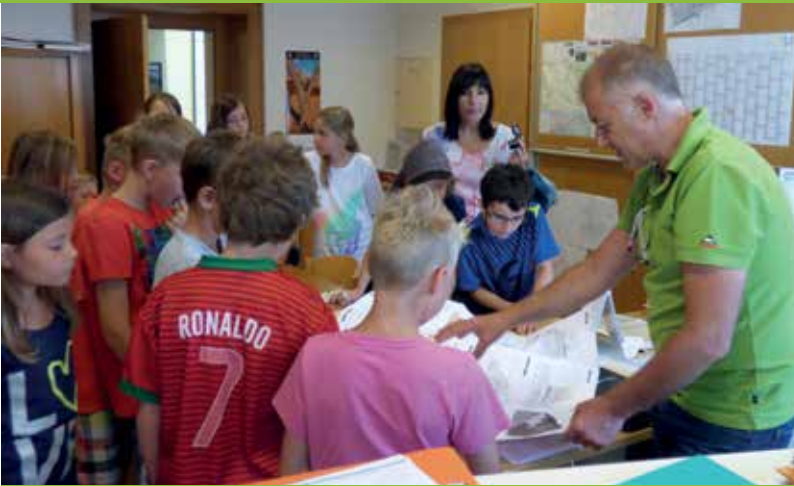
VOLKSSCHULE ZU BESUCH IM GEMEINEDAMT