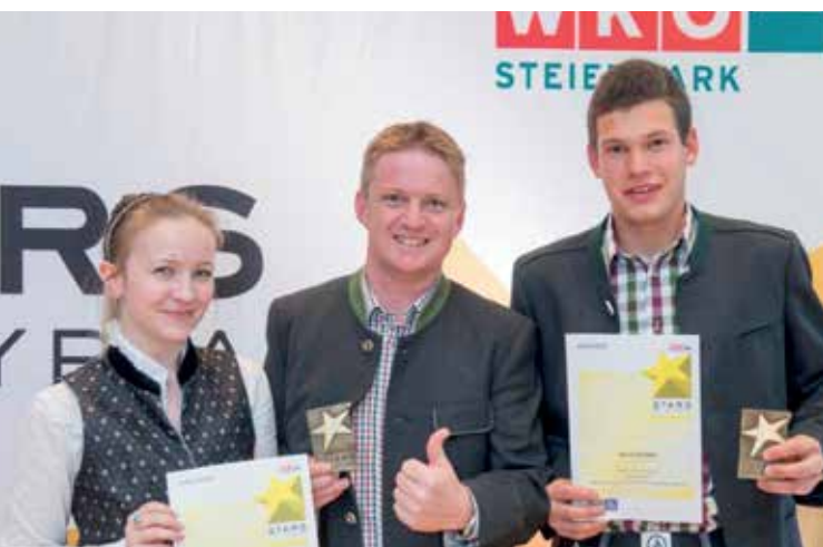
STARS OF STYRIA - LETMAIER GRÖBMING BAUGESMBH