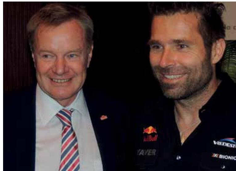
HANNES ARCH ZU BESUCH BEI DER ENNSTAL-CLASSIC