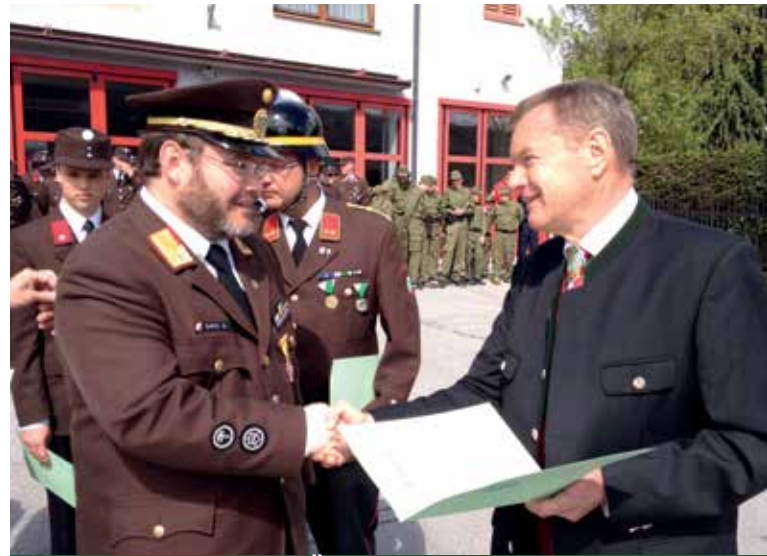
GROSSE EHRUNG FÜR DIE FREIWILLIGE FEUERWEHR GRÖBMING FÜR IHREN EINSATZ BEI DER KATASTROPHE IN ST. LORENZEN