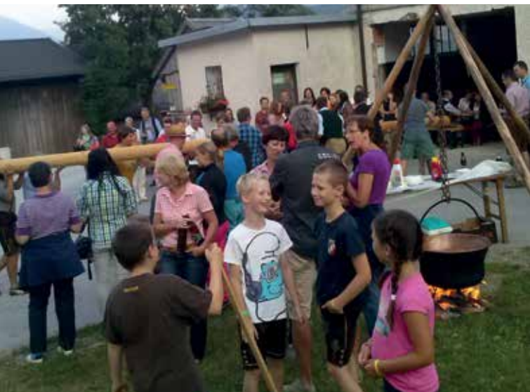
MAIBAUMGAUDI IN WEYERN