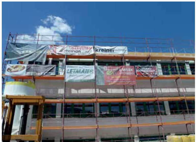
ERSTER FERIENTAG - START ZUR 3,6 MILLIONEN EURO SANIERUNG DER HAUPTSCHULE GRÖBMING