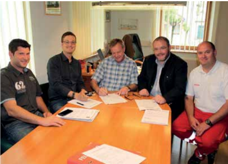
UNTERSCHRIFT AUF DEM GEMEINSAMEN FÖRDERANSUCHEN DER MARKTGEMEINDE UND DER FREIWILLIGEN FEUERWEHR GRÖBMING FÜR DEN NEUEN RÜSTHAUSBAU