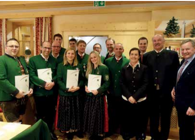
EHRUNG VERDIENTER MUSIKER UND MUSIKERINNEN