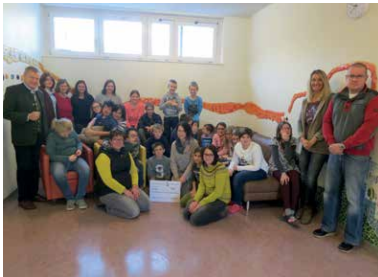
SCHECKÜBERGABE FA. PROWIN AN DAS ZIS GRÖBMING