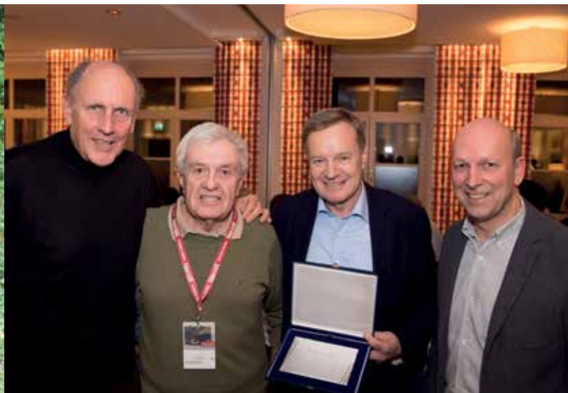
DIE MARKTGEMEINDE GRÖBMING ERHIELT EINE AUSZEICHNUNG VON DER PLANAI-CLASSIC