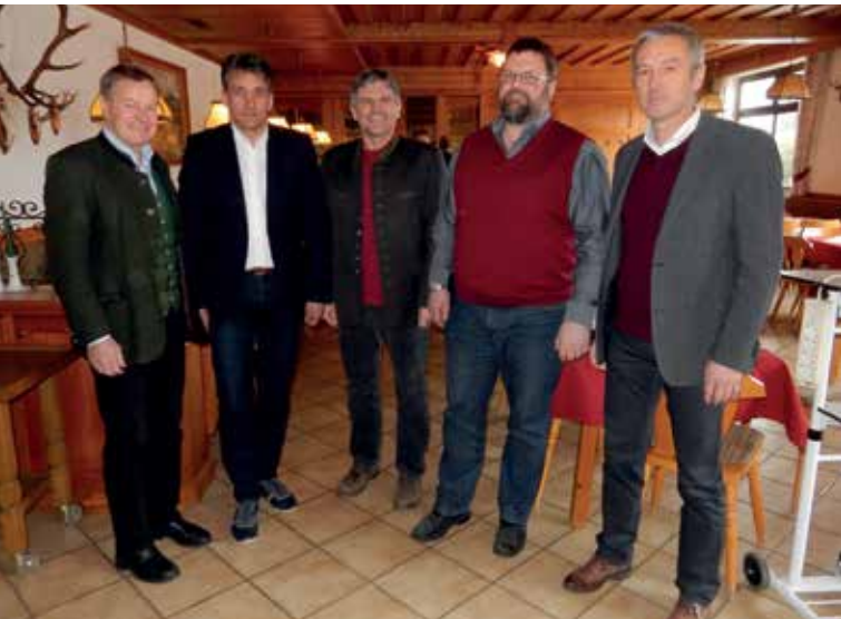
BÜRGERMEISTER DER KLEINREGION GRÖBMING