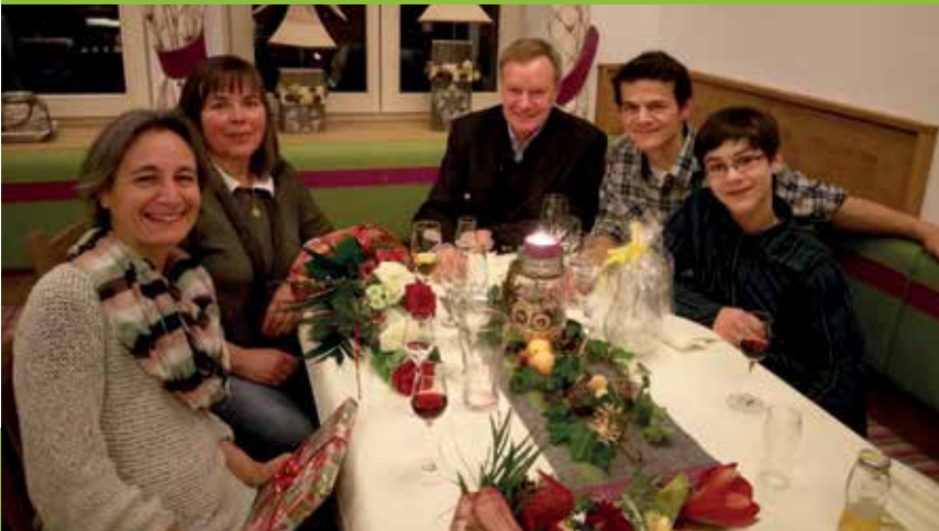
5 JAHRE TREUE ZU GRÖBMING BEI FAM. PILZ - STODERTRAUM