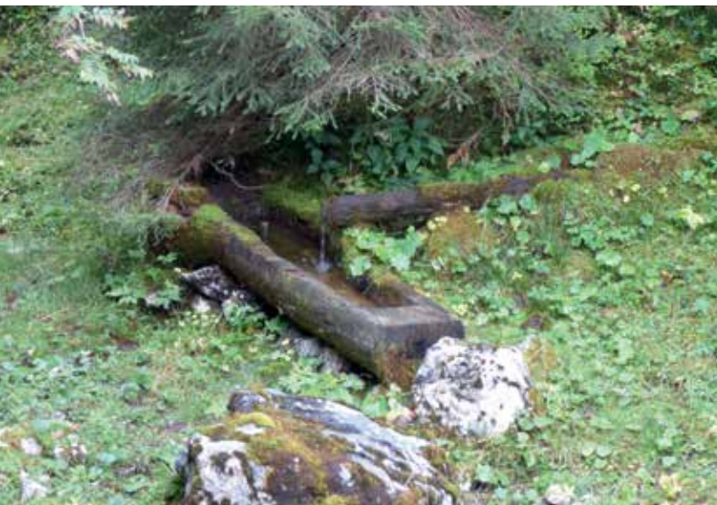
DIE ERWEITERUNG DER WASSERVERSORGUNG FÜR DIE MARKTGEMEINDE GRÖBMING WURDE BESCHLOSSEN

Der Rücklagenstand per 31.12.2016 beträgt 77.000,00 Euro.