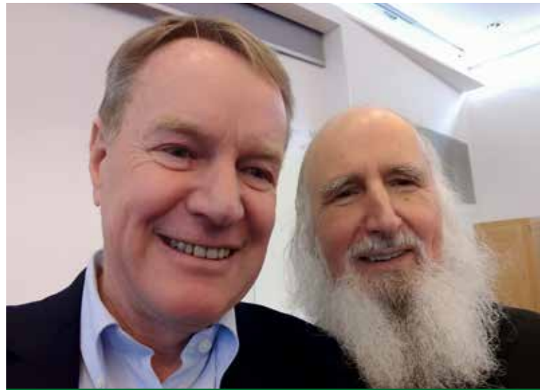
EIN BESONDERER TAG MIT DEM BESTSELLERAUTOR UND BENEDIKTINERMÖNCH ANSELM GRÜN

Kinderkrippe und die Mittagsbetreuung in der Volksschule wird weiter im Sozialzentrum in Gröbming gekocht. Danke bei allen Beteiligten, dass wir so „Essen auf Rädern“ in der Gemeinde beibehalten konnten.