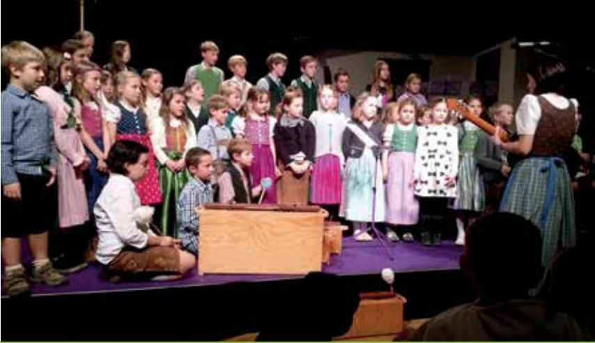
RÜCKBLICK: EIN BESONDERES ERLEBNIS - MUSIK- UND VOLKSCHULE GESTALTETEN GEMEINSAM EINE WEIHNACHTSFEIER