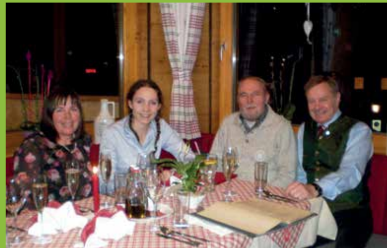
10 JAHRE TREUE ZU GRÖBMING BEI FAM. PILZ - STODERTRAUM