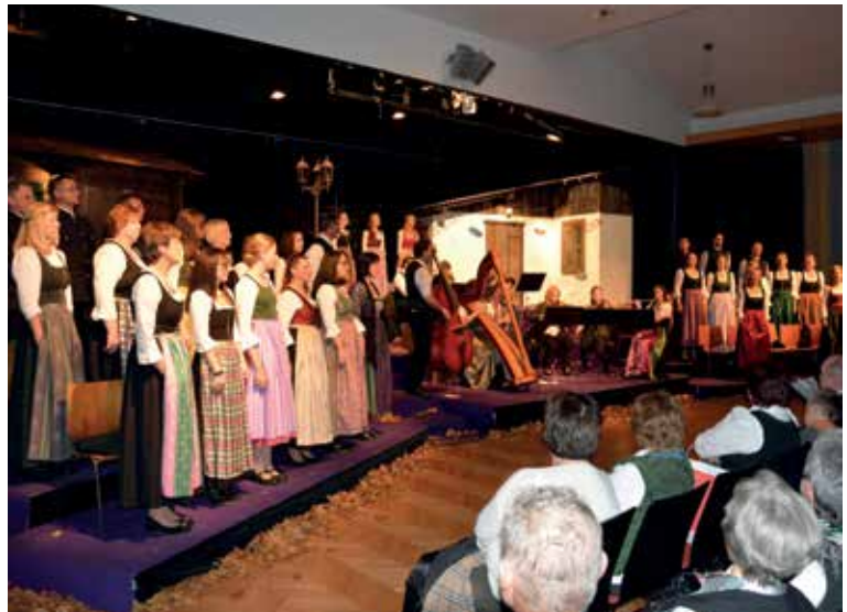
RÜCKBLICK: ENNSTALER ADVENT IN DER KULTURHALLE