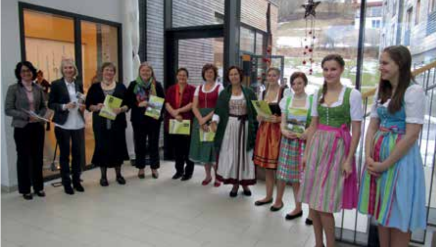
TAG DER OFFENEN TÜR IN DER FACHSCHULE FÜR LAND- UND ERNÄHRUNGSWIRTSCHAFT GRÖBMING