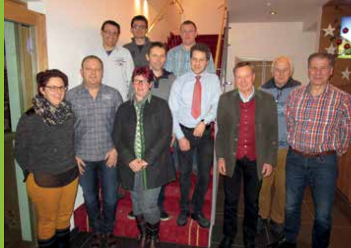
JAHRESHAUPTVERSAMMLUNG DES TUS GRÖBMING BEIM LOY