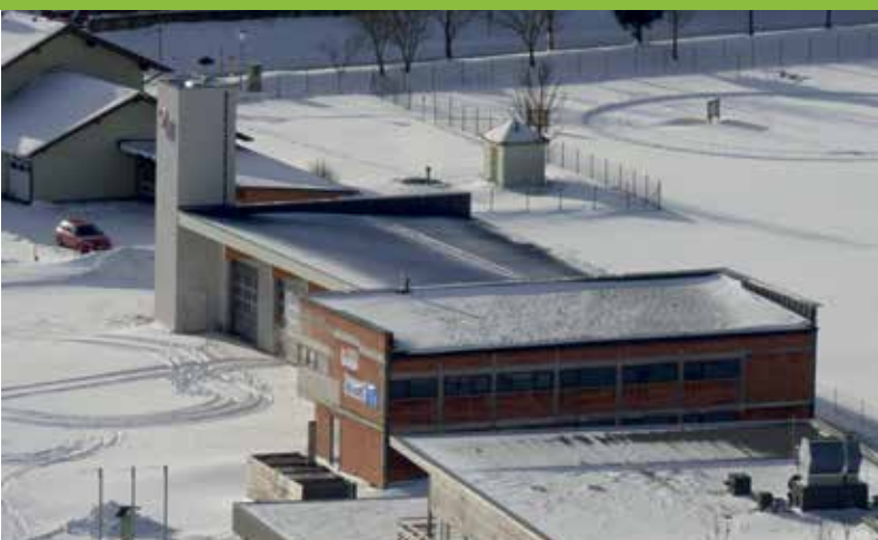
RÜSTHAUS DER FF GRÖBMING VON OBEN