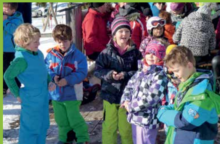
KINDERGARTENSKIKURS AM STODERZINKEN