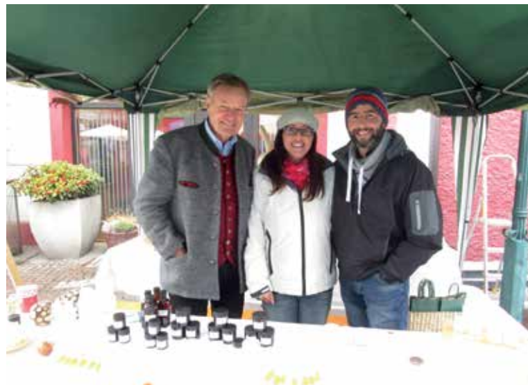
DANKE AN DIE ORGANISATOREN DES OSTERMARKTES IN GRÖBMING