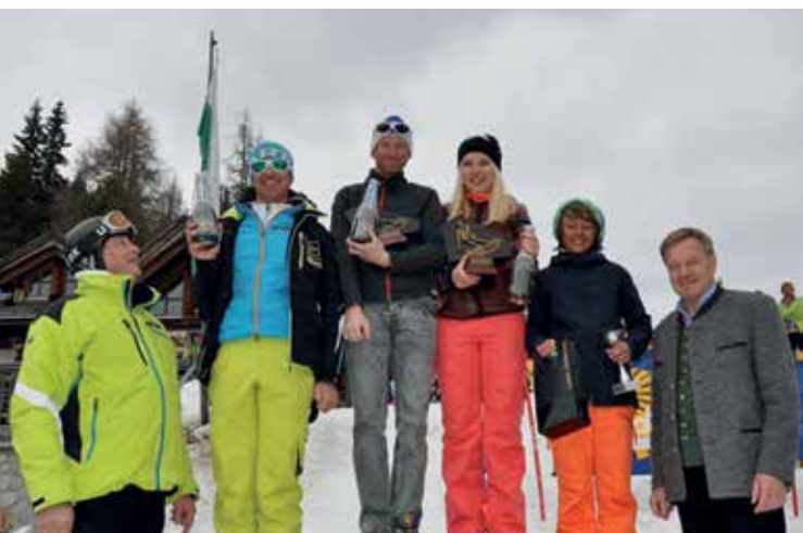
SIEGEREHRUNG VEREINSMEISTERSCHAFT UND VOLKSSCHITAG DES SCHIKLUB RAIFFEISEN GRÖBMING AM STODERZINKEN

wenn die Autofahrer keine Rücksicht auf Kindergruppen nehmen und bei den Zebrastreifen nicht stehen bleiben. ■