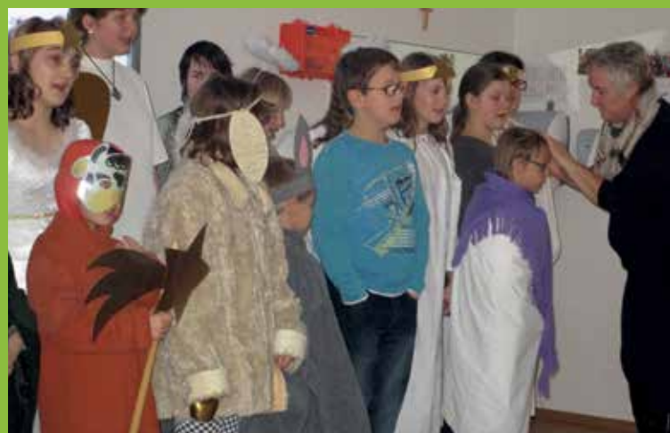
HIRTENSPIEL IM ZENTRUM FÜR INKLUSIV- UND SONDERPÄDAGOGIK GRÖBMING