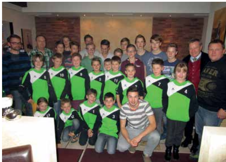
HERBSTMEISTERTITEL DES TUS GRÖBMING - U11 UND U15

unser ältester Gröbminger ist 101 Jahre alt geworden