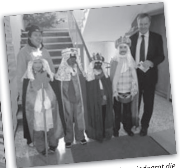
Zu Besuch im Jänner 2012 im Gemeindeamt die Heiligen Drei Könige