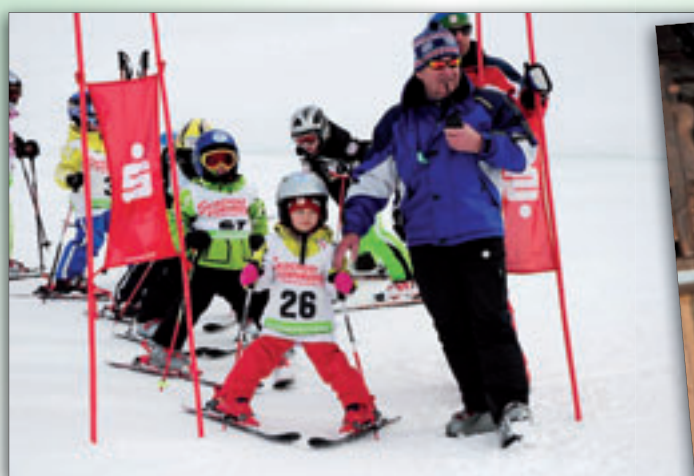
Kindergarten-Schikurs am Stoderzinken