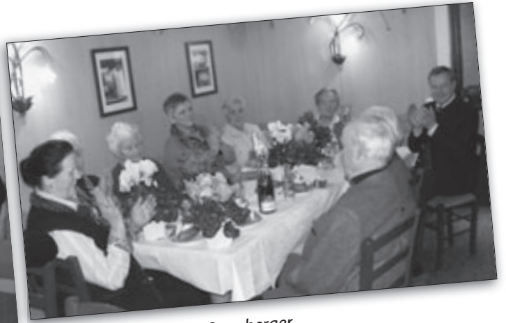
Senioren-Geburtstagsfeier im Dezember 2011 – Imbiss Stube Spanberger