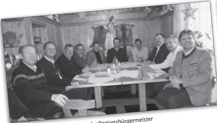
Quartalsmäßige Besprechung der Regionsbürgermeister