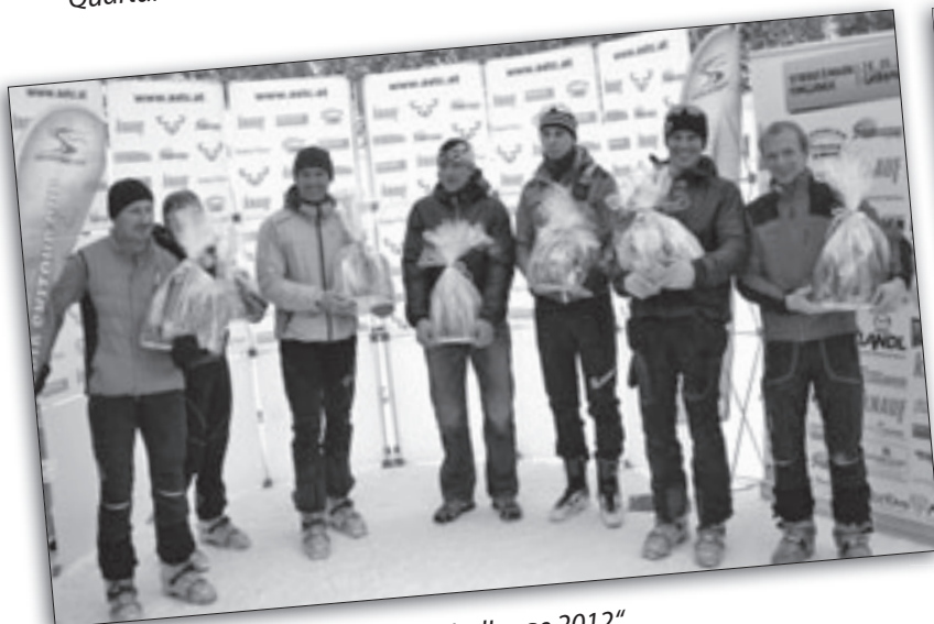
Siegerehrung am Stoderzinken „Challenge 2012“