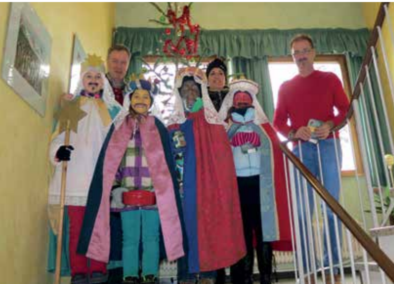
DIE HEILIGEN DREI KÖNIGE ZU BESUCH IM JÄNNER 2014 IM GEMEINDEAMT

Bei der neuen GWS Siedlung wird die Zufahrt für die neuen Häuser in Zusammenarbeit mit der GWS gebaut.