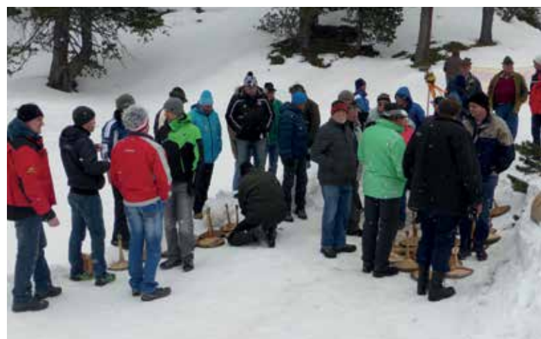
NACH 18 JAHREN GAB ES WIEDER EIN STODEREISSCHIESSEN