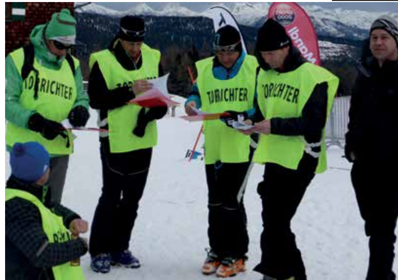
ORGANISATION DER 4. KNAUF STODERZINKEN CHALLENGE