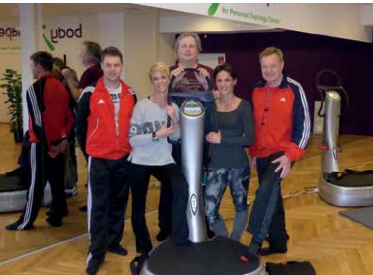
ERÖFFNUNG DES BODY SHAPE STUDIOS IM PANORAMABAD