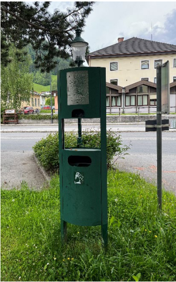
So sehen die Hundestationen aus.

Das Betreten von landwirtschaftlichen Flächen ist in den Wintermonaten auf dem ausgewiesenen Winterwanderweg gestattet.